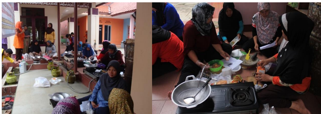
Gambar 3. Praktek fun cooking serta pembagian kelompok

Kegiatan ketiga adalah praktek fun cooking yaitu berupa praktek membuat makanan jajanan sehat yaitu Nugget Ayam Sayur yang dipilih karena disukai semua anak-anak dan bisa dengan mudah dibuat di rumah dengan nutrisi penuh dan aman dari zat berbahaya. Dalam praktek ini peserta dibagi menjadi lima kelompok untuk membuat sebuah makanan dengan resep yang dibagikan kepada seluruh peserta dengan bahan-bahan yang sudah dipersiapkan. Untuk peralatan dipersiapkan oleh setiap kelompok dan diberikan daftar peralatan sehari sebelumnya. Kelompok yang memberikan hasil yang paling enak akan diberi hadiah. Kegiatan ini juga memberikan beberapa peralatan memasak (dandang/pengukus, talenan, wajan, baskom,