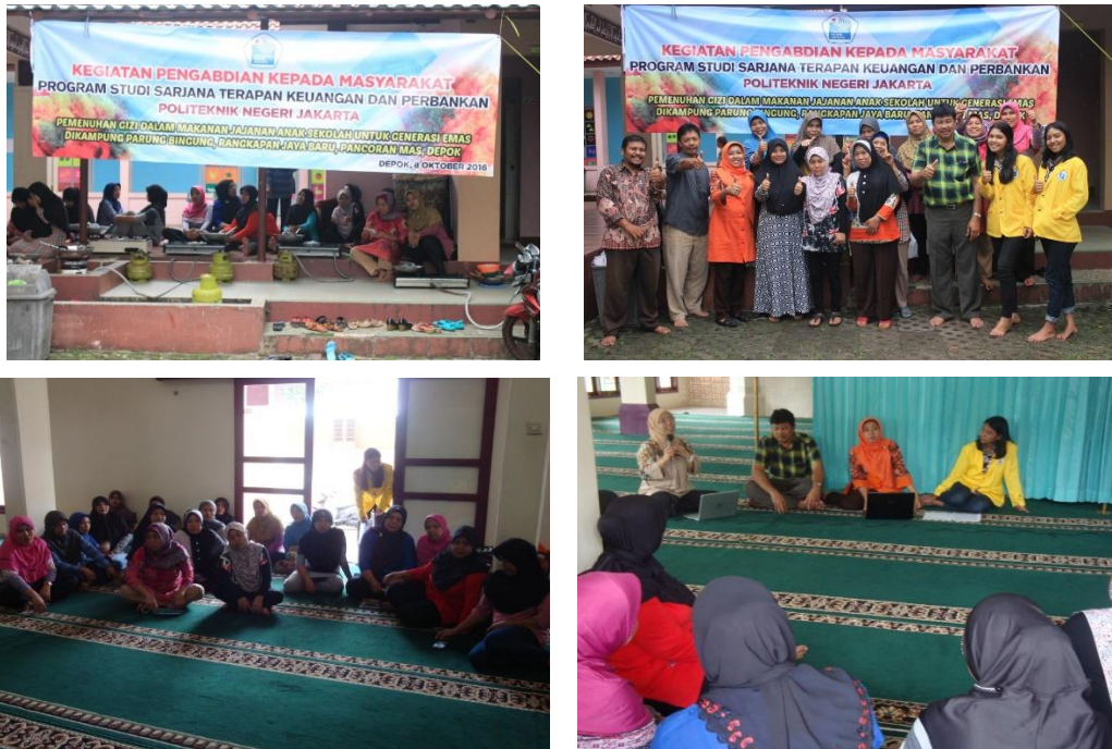
Gambar 2. Peserta kegiatan mendengarkan materi dari Narasumber

mudah didapat, enak, praktis dan menghemat waktu, cantik dan lebih menarik, serta beragam jenisnya. Terdapat pula beberapa bahan berbahaya yang terkandung di dalam makanan jajanan.