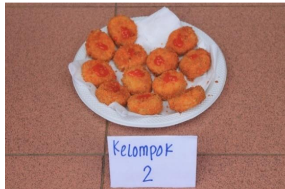
Gambar 4. Kegiatan fun cooking dan tampilan hasil Nugget Ayam Sayur