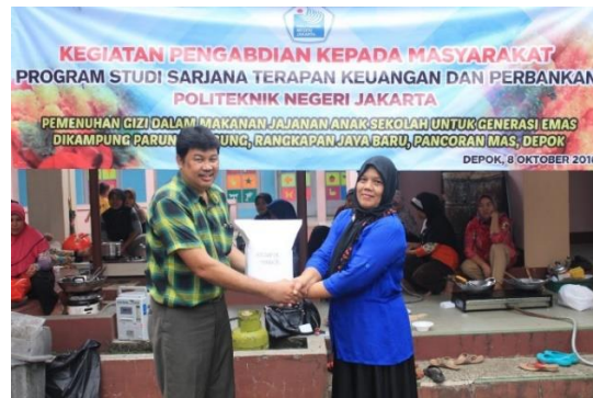
Gambar 5. Penilaian hasil lomba fun cooking dan penyerahan hadiah

Setelah kegiatan selesai terlihat indikator keberhasilan dari kegiatan ini dari jumlah peserta yang memenuhi target dan semuanya mengikuti kegiatan dari awal sampai akhir, selain itu peserta juga aktif bertanya dan sangat antusias dengan materi yang diberikan. Pada saat kegiatan praktek fun cooking dalam bentuk kelompok, mereka saling bekerja sama dan sebagian besar dari mereka memang senang memasak. Beberapa peserta juga meminta untuk diadakan lagi kegiatan serupa untuk menambah ilmu dan wawasan mereka. Selain itu, dengan pemberian resep dan alat memasak, para peserta dapat langsung mempraktekkannya di rumah dalam membuat jajanan anak sekolah yang sehat, bersih dan bergizi.